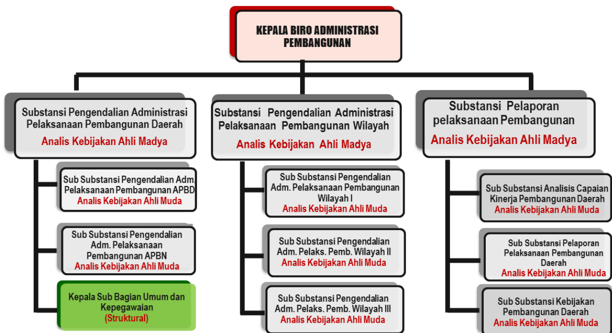
Struktur Organisasi Biro Administrasi Pembangunan Setda Provinsi Jawa Timur